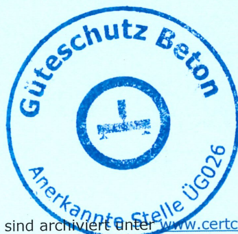
Dr.-Ing. S. Zwolinski Leitung der Zertifizierungsstelle

Zertifikate und Bescheinigungen sind archiviert unter www.certchain.eu . Während ihrer Nutzungsdauer verunreinigte Betonteile sind ausgeschlossen oder müssen ergänzend überprüft werden.