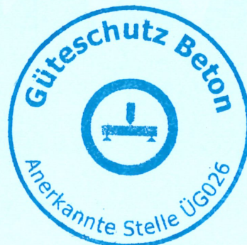
Dr.-Ing. S. Zwolinski Leitung der Zertifizierungsstelle

Zertifikate und Bescheinigungen sind archiviert unter www.certchain.eu . Während ihrer Nutzungsdauer verunreinigte Betonteile sind ausgeschlossen oder müssen ergänzend überprüft werden.